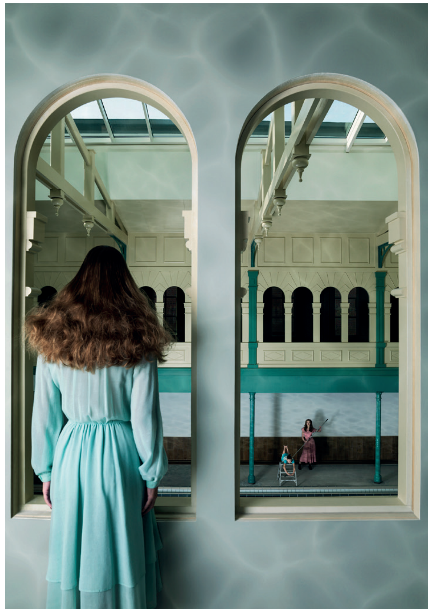
Het zwembad aan de Mauritskade was het decor voor de serie Reflections of History. Dit beeld heet Lesson to Learn. "Mijn taferelen zijn vaak surrealistisch met een wat dromerige sfeer"