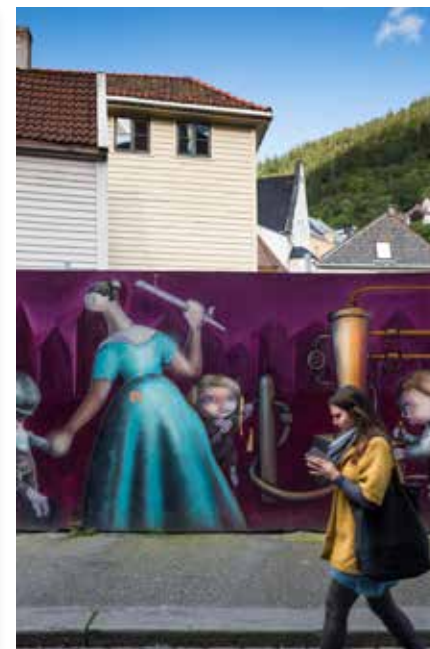
Van linksboven naar rechtsonder: Bryggen, straatje in Stølen, restaurant Lysverket, Grieghallen, gerecht van Colonialen en straatbeeld in Skostredet

kers uit de zee. KODE is de verzamelnaam van vier musea rond de achthoekige vijver Lille Lungegårdvannet. Dit is een populair park en rustpunt in het centrum. Bij KODE vind je van renaissance- tot moderne kunst. Vlak achter de vijver doemt de spiegelende gevel van de Grieghallen op. Deze concertzaal is vernoemd naar de beroemdste persoon die Bergen voortbracht: componist Edvard Grieg. Een bezoek aan de berg Fløyen mag niet ontbreken. Na drie kwartier word je beloond met een magnifiek uitzicht. Wie al genoeg kilometers in de benen heeft, kan zich ook door het treintje, de funicular Fløibanen, laten vervoeren. Vanaf het brede terras kijk je uit over de stad, de fjorden en de zee. Beneden zie je de boten uitvaren en zo krijg je alleen maar meer zin om de fabuleuze fjorden van dichtbij te zien. En laat Bergen daarvoor nu de ideale uitvalsbasis zijn.